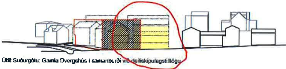
Útlit Suðurgötu: Gamla Dvergshús í samanburði við deiliskipulagstillögu

Gerð er athugasemd við byggingu húss 2a sem sett er niður, á því sem næst auðan reit miðað við fyrra skipulag, og mun blokka útsýni til vesturs fyrir íbúa Brekkugötu og Lækjargötu og jafnframt eyðileggja útsýn vegfarenda um Suðurgötu, Lækjargötu, Strandgötu og Fjarðargötu, uppá eina helstu heillegu götumynd húsa á Íslandi sem eru yfir 100 ára gömul.