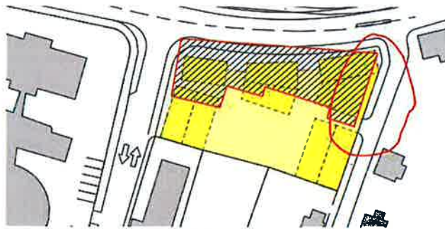
Athæfa: Gamla Dvergshúsi í samanburði við deiliskipulagsálliðögu

Gerð er athugasemd við færslu bygginga í austur og þar með þrengt að gangstétt og húsin færð alltof nálægt húsunum sem standa í Brekkugötunni.